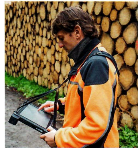
Zum Lieferumfang gehört auch ein Tragesystem, mit dem die Formularbearbeitung deutlich angenehmer wird

Der eigentlich geeichte Teil des Messergebnisses ist der exakte Umriss des Holzstapels, die sogenannte Hüllkurve. Daraus ergibt sich über einen Reduktionsfaktor und mit der Zusatzinformation der Sortimentslänge das Raummaß des Polters. Selbstverständlich kann LogStackPro aber auch alle anderen bekannten Informationen einer Fotovermessung liefern, als da wären: Stückzahl, Festmaß und Stärkeklassenverteilung. Für das Festmaß muss man unter Umständen noch ein wenig die erkannten Stirnflächen der einzelnen Stämme nachbearbeiten und auch die nicht sichtbaren Polterunterlagen zahlenmäßig angeben. Vor allem bei sehr schwachem Holz mit geringer Durchmesserstreue wird empfohlen, zusätzlich eine Nahaufnahme von ungefähr 25 % der Polterstirnfläche zu machen, um die Ergebnisse zu präzisieren. Diese ganzen Informationen, zusammen